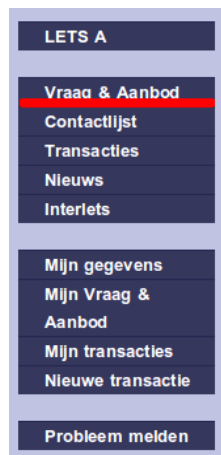
Illustration 7: Navigatie, Vraag & Aanbod

De hoofdpagina van Vraag en Aanbod is opgedeeld in 2 onderdelen: