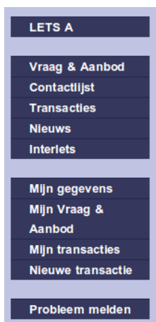
Illustration 4: eLAS navigatiebalk

Beheerders vinden hier ook een blok waarmee ze de gegevens in eLAS kunnen beheren.